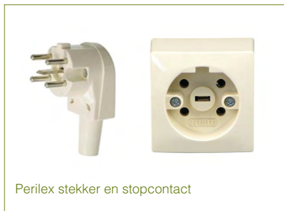
Perilex stekker en stopcontact

Verkeerd aansluiten kan zorgen voor een defecte kookplaat.