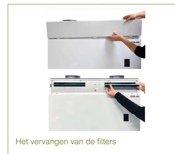
Het vervangen van de filters