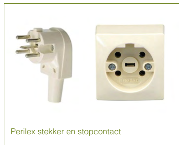
Perilex stekker en stopcontact

Je kookt elektrisch want er is geen gasaansluiting. Er zit een Perilex stopcontact in de keuken voor de aansluiting van een elektrische kookplaat. De kookplaat moet