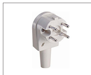
Voorbeeld van een Perilex-stekker