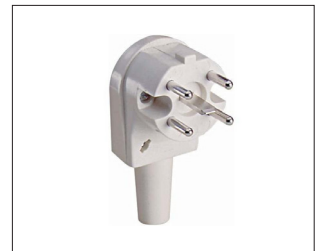
Voorbeeld van een Perilex-stekker

Een medewerker van Hurkmans controleert of de aansluiting zwaar genoeg is. Is de aansluiting niet zwaar genoeg? Dan passen we de meterkast aan. Hurkmans beoordeelt ook hoe de gasleiding verwijderd wordt. Hurkmans maakt een afspraak met u.