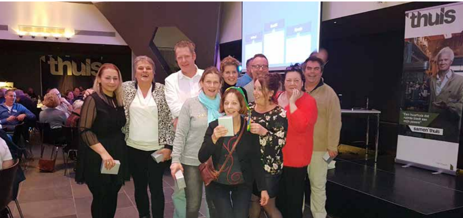
Foto KBG De Straten op de bedankavond van 'thuis

Alle vrijwilligers waren uitgenodigd voor de jaarlijkse bedankavond van 'thuis . Vele klankbordgroepleden kwamen. De KBG van De Straten sleepte de eerste prijs in de wacht bij de landenquiz die werd gehouden.