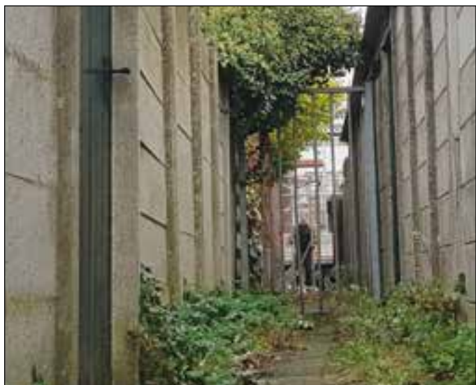
Tegels gaan weg voor betere waterafvoer, we vervangen kapotte tegels en snoeien overhangend groen