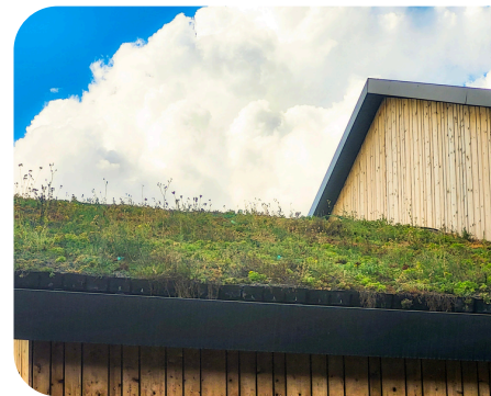
In beeld: ROEF in de verschillende seizoenen en herstel na droogte.